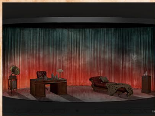
escenografia El caballero incierto Anna Tusell